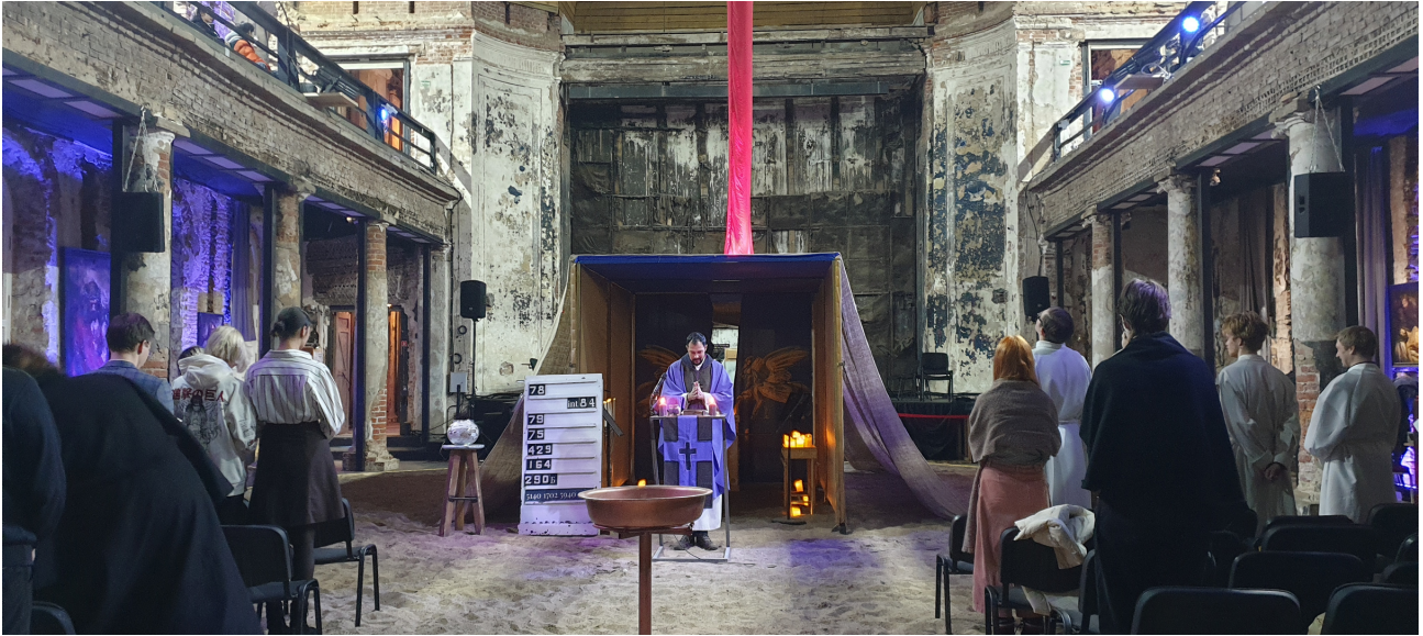
Pääsiäisnäyttelyä varten on Pietarin Pyhän Annan kirkon kirkkosalin lattialle tuotu 10 tonnia hiekkaa ja pystytetty ilmestysmaja. Oli puhuttelvaa saada osallistua siellä ehtoolliselle.