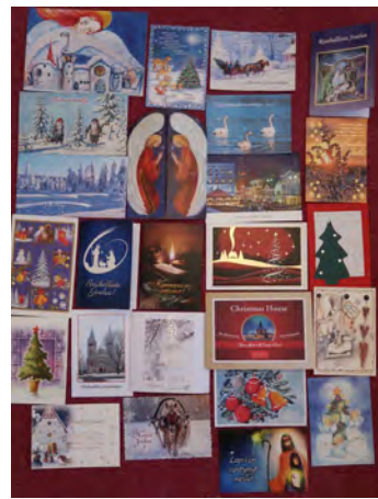
"Oikeaa" postia ei voita mikään. Kiitos teille, jotka olette vuosien varrella meitä muistaneet! Tässä joulun saldo.

30.1. ollaan järjestämässä nuorille suunnattua jumalanpalvelusta. Ainakaan tässä vaiheessa meillä ei ole asiaan liittyen varsinaisia velvoitteita. Tarkoitus on kuitenkin osallistua siihen ja ottaa omatkin nuoret iltajalanpalvelukseen mukaan. Pyydämme teitä rukoilemaan myös tuon tilaisuuden puolesta, että jumalanpalveluksen järjestelyt sujuisivat, sinne tulisi väkeä ja että se olisi siunaukseksi siihen osallistuville.