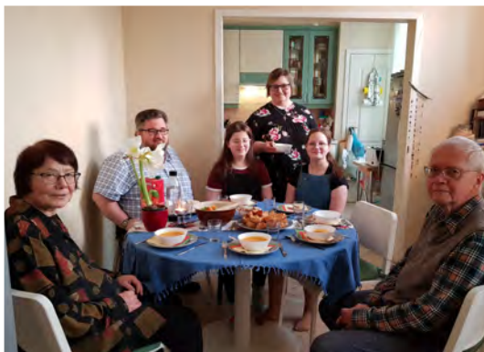
Yhteinen ateria ystävien kanssa