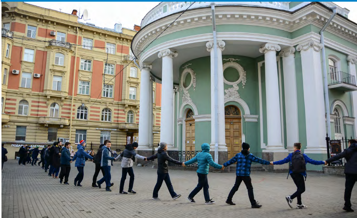
Koululaiset Annan kirkkoa halaamassa.