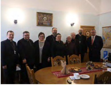
SEKLin delegaatio onnittelemassa piispa Aarre Kuukauppiä 8. helmikuuta