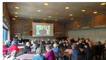
Kiiämme ihanista kohtaamisista Tapiolassa ja Martinristissä, kun saimme taas kertoa työstämme ja Inkerin kirkosta