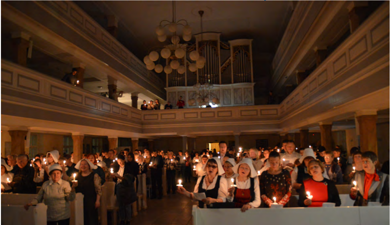
Näin suurella joukolla laulettiin joululauluja Pietarin Pyhän Marian kirkossa viime vuonna. Tämänvuotinen kirkon yhteinen joulujuhla on peruttu, mutta vielä on auki, miten se voitaisiin järjestää netin välityksellä. Ja kuten arvata saattaa, niin ikävöimme kovasti Pietaria ja siellä olevia rakkaita ystäviä. Joulua tulee silti ulkoisista puitteista huolimatta, kunhan vain avaa sydämen sen sanomalle.