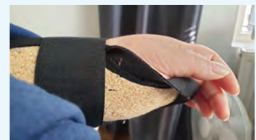
Tottelematon ranne tarvitsee lastan, vaikka luita ei mennyt poikki.